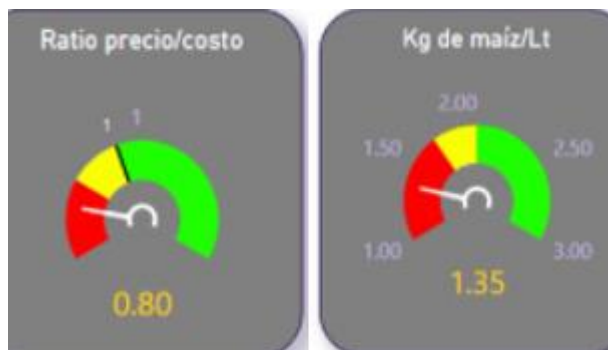
GRÁFICOS: Consultora Economía Láctea

La producción de leche ha llegado a su piso estacional. Hoy está estable y pronto, junto con las pariciones, iniciará su remontada otoñal. El rendimiento de los maíces para silo ha sido muy dispar este año con bastantes resultados regulares/malos (se contará con menos reservas) y las lluvias de mitad de mes en adelante van a ayudar a sembrar pasturas y verdeos de invierno, pero ya menos a los maíces tardíos. Sigue mal la ratio precio/costo y la relación leche/maíz.