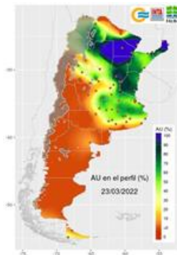
PORCENTAJE DE AGUA ÚTIL EN EL PERFIL

Para MAR-ABR-MAY el SMN pronostica lluvias normales/inferiores a lo normal y temperaturas normales/superiores a las normales.